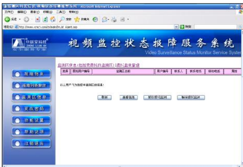
委托监测管理界面

(1) 进入监测区信息，换到“委托监测管理”界面。点击“授权委托监测”按钮，系统自动弹出“委托监控授权”窗口，用户根据自身需要可以对指定方进行委托监控（监控权）与完全授权（监控与修改完整权）。