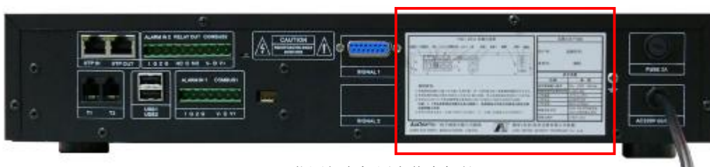
VSM 监测仪主机用户信息标签

每一台视频状态监测仪都有用户信息资料,包括用户编号、系列号、监测区号、密码。这些信息标记在监测仪说明书和监测仪面板的信息贴上,两者的信息内容是一样的。在注册之前请用户检查上述信息资料,如发现缺损等情况请与我们联系。用户必须登陆我们的“视频监控状态报障服务系统”网站进行注册登记,用户才能正式启用监测仪并接收状态报障服务信息。