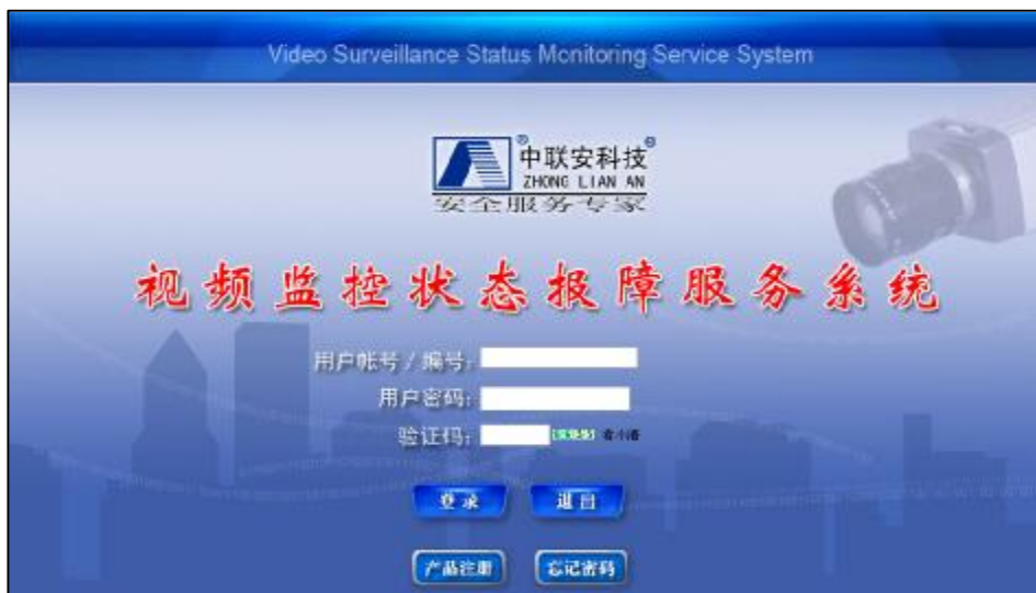
视频监控状态报障服务系统登陆界面

另外就是在网络地址栏上输入 http://www.vsmcn.com ，直接进入“视频监控状态报警系统”界面。