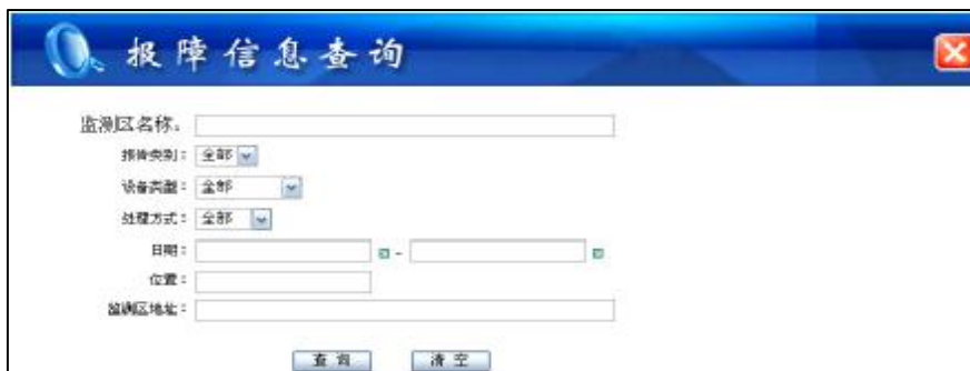
报障信息查询界面