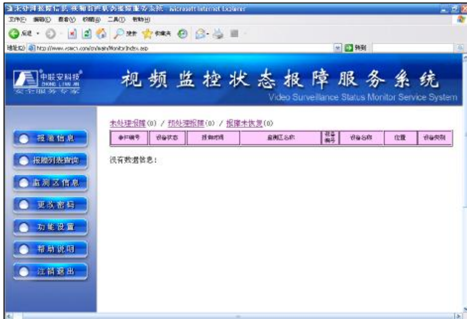
用户登陆后显示的主界面