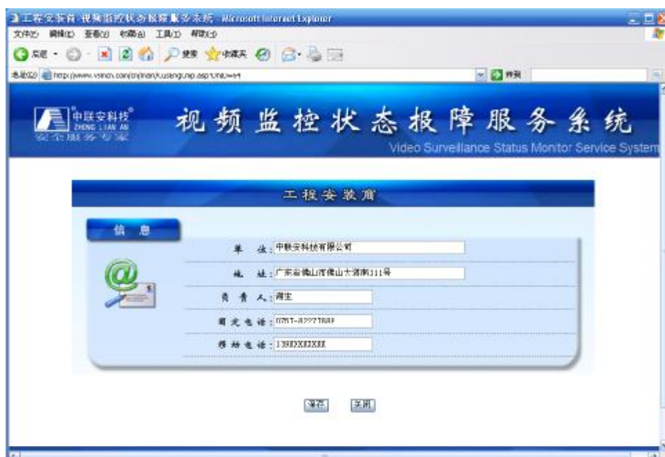
工程安装商填写与查看界面