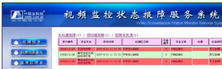
出现报障信息的主界面

未处理报障：第一时间收到的监测设备的故障状态报告信息。当监测设备发生故障时，系统自动用红色标记信息，表示监测的设备发生了故障。让客户一目了然地了解设备状态，及时作出相应维修决策；当收到监测设备故障恢复信息时，系统自动用绿色标记信息，表示对应故障信息设备号码的维修完成，设备再次正常工作。点击故障信息，可以详细了解信息内容，包括报障时间、报障设备名称、监测区名称、工程商和维护商资料信息，并可以记录操作内容，作“处理”、“预处理”操作。