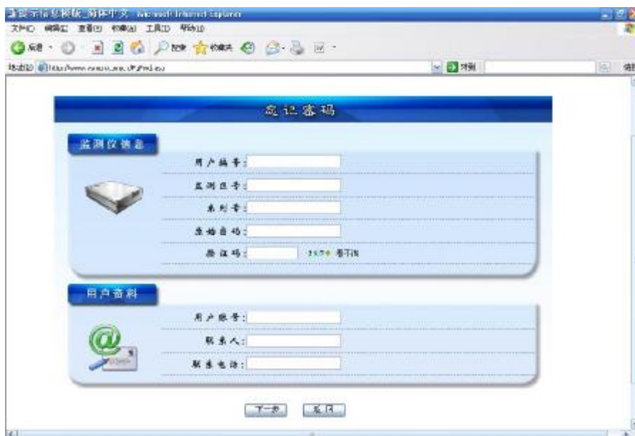
忘记密码找回界面