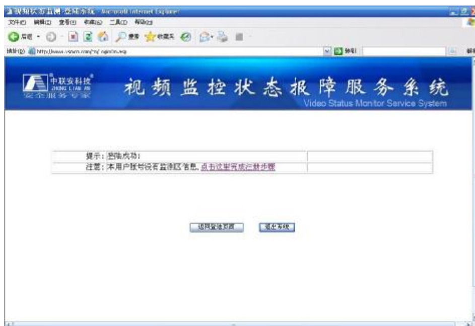
注册时不完全时信息提示界面