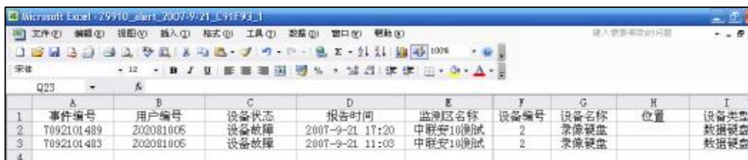
导出后的 Excel 信息

选择监测区后，更可以在下方选择更新监测区联系信息、设备信息、工程师信息与维护商信息，使客户随时能查看并修改信息内容，保持您与我们的紧密联系。