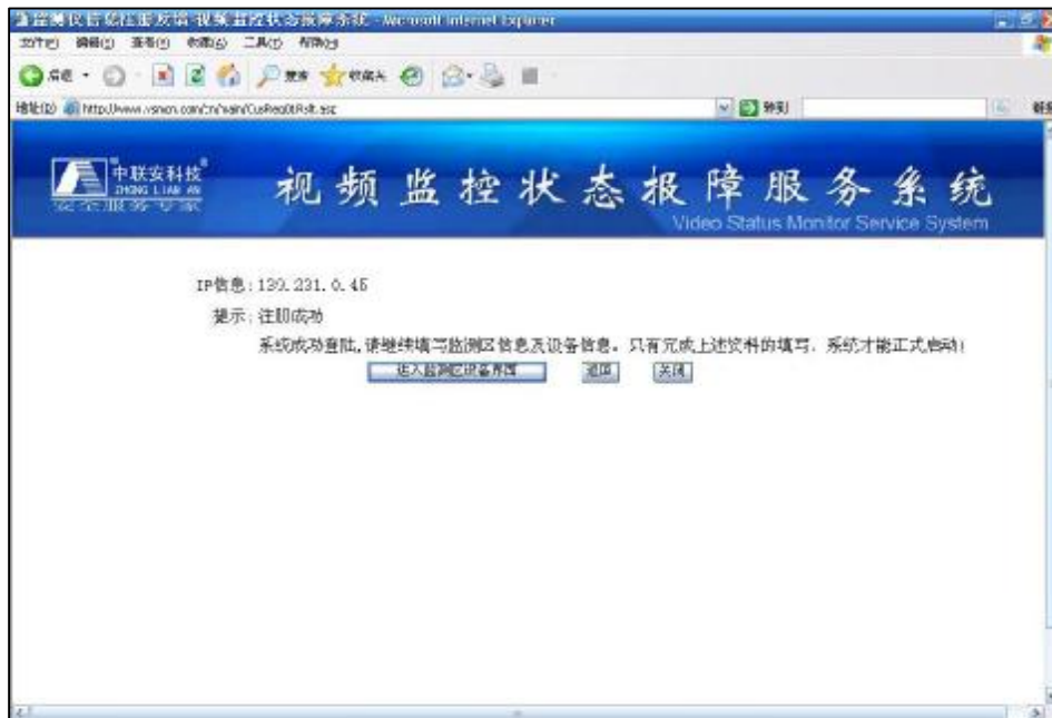
产品注册成功提示