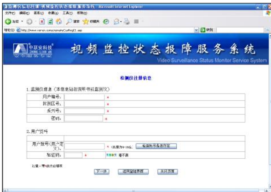
检测仪注册信息界面