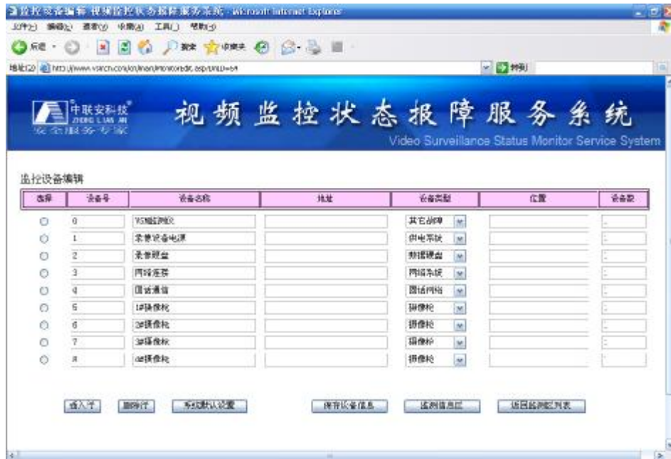
监控设备编辑界面