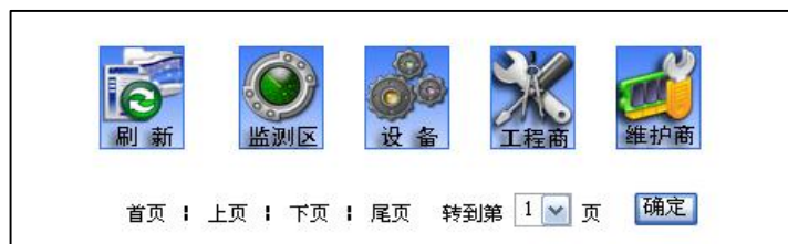
监测区信息导航栏